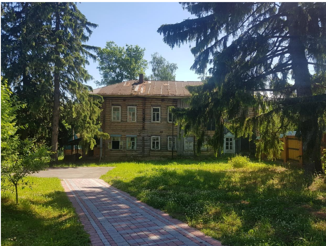
Объект и его территория. Вид с северной стороны.