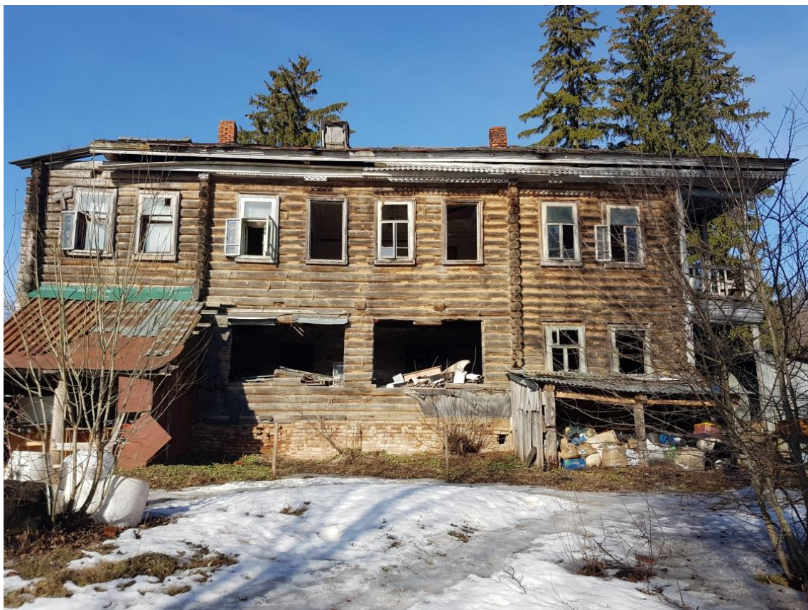
Южный фасад. По состоянию на 03.2020.