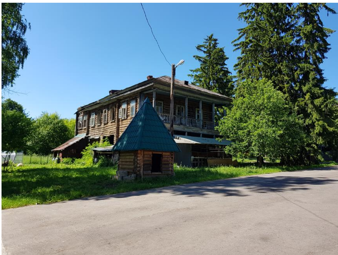
Объект и его территория. Вид с юго-востока.