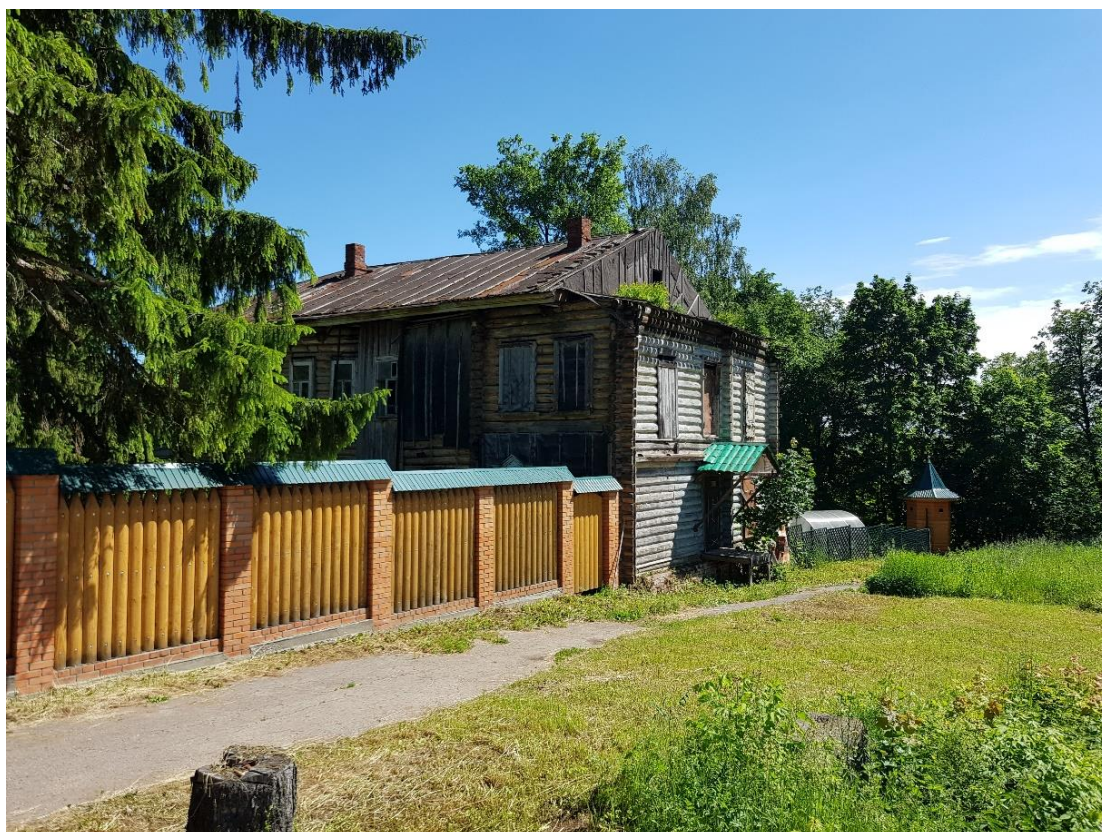
Вид с северо-запада