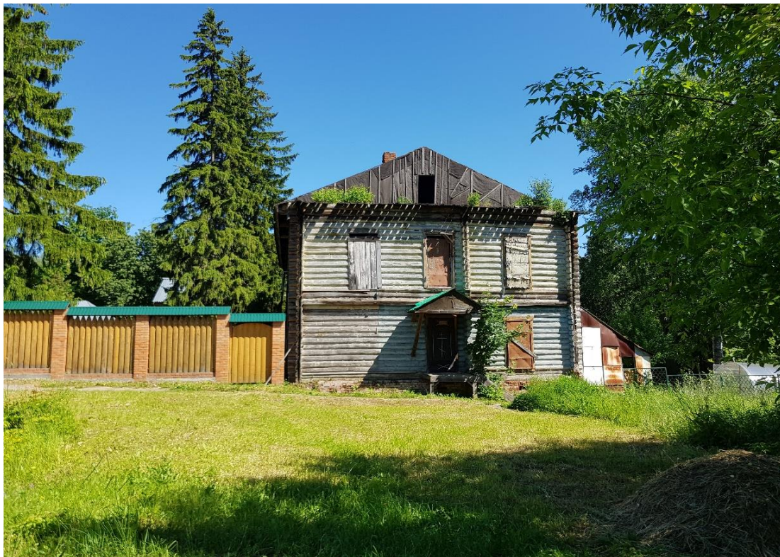
Вид с западной стороны