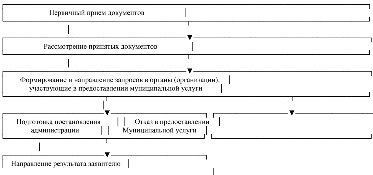
Блок-схема предоставления Муниципальной услуги «Утверждение схемы расположения земельного участка или земельных участков на кадастровом плане территории»