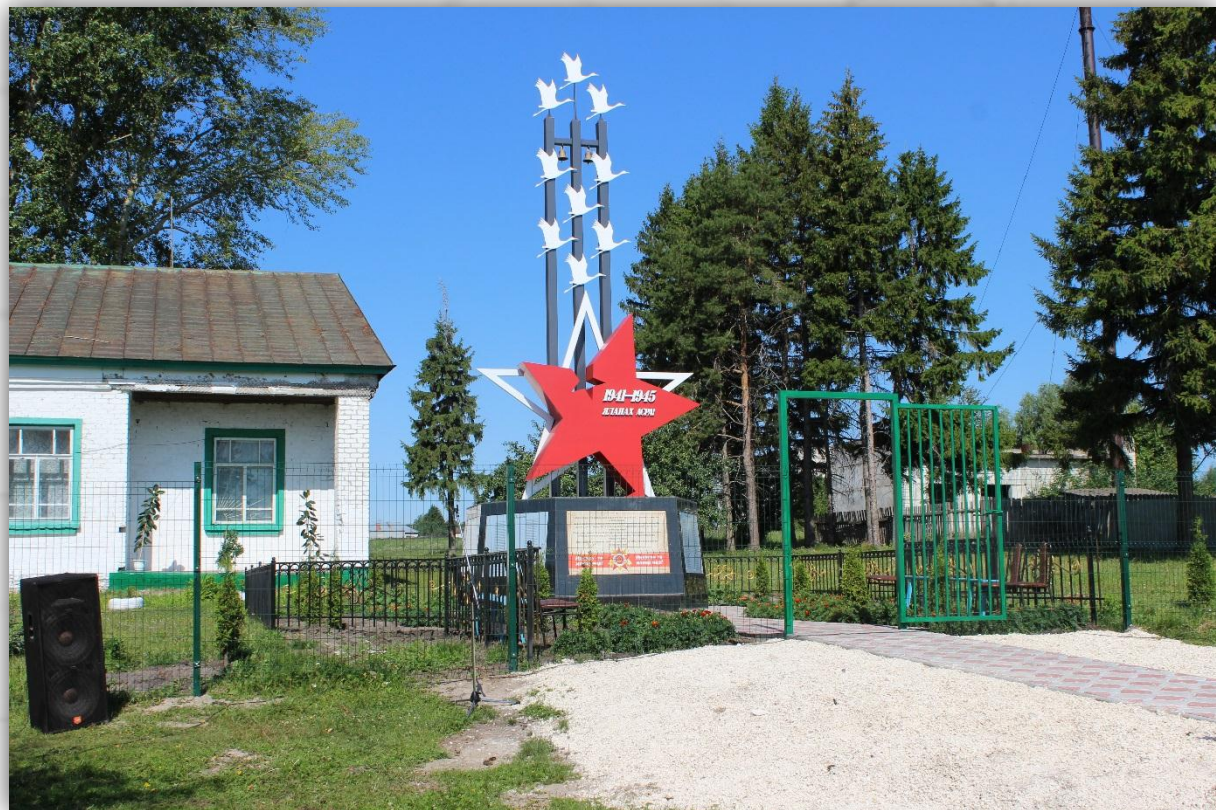
После проведения работ

Изготовление памятника воинам-односельчанам, павшим в ВОВ 1941-1945 гг. и обустройство сквера вокруг памятника в с. Шемалаково на сумму 1021,0 тыс.рублей