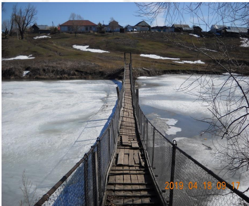
Первоначальное состояние висячего моста до ремонта

Ремонт висячего моста через реку Таябинка в с. Большая Таяба на сумму 179,3 тыс.руб