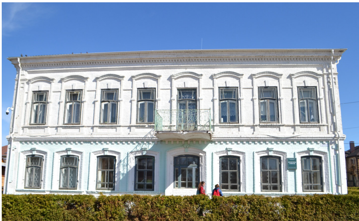
Фото 1. Существующий фасад по ул. Московской

1 этаж главного фасада по улице Московская, 1 этаж фасада по ул.