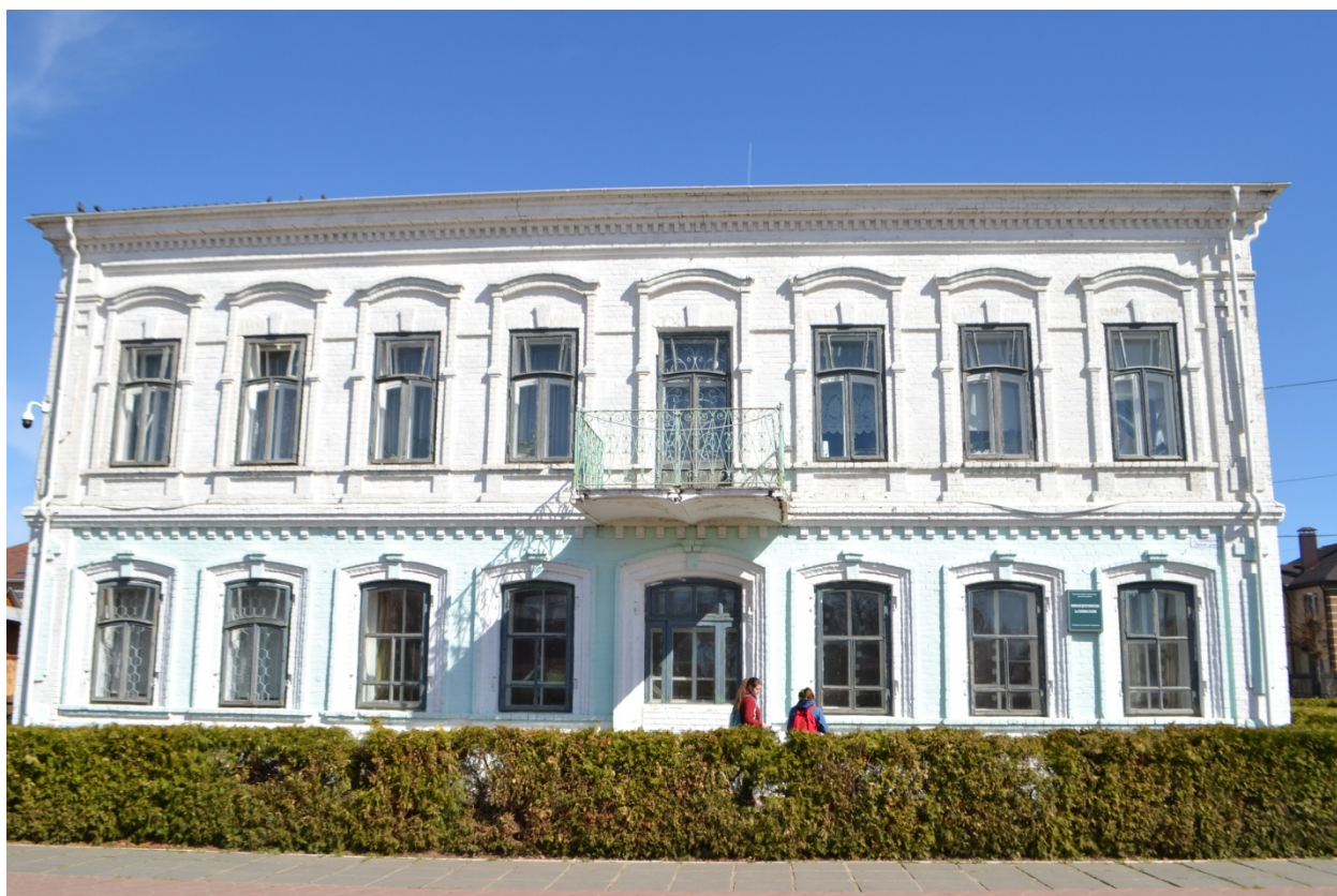
Фото 1. Существующий фасад по ул. Московской

В настоящее время фасады здания окрашены в разные цвета: