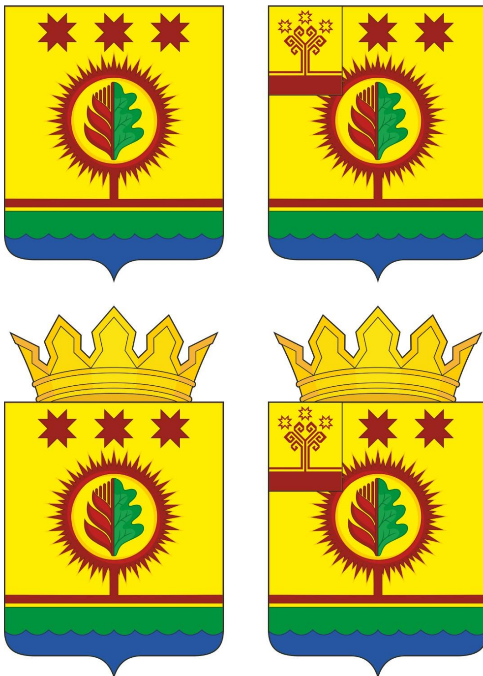
Герб Шумерлинского района Чувашской Республики (примеры воспроизведения в цвете)