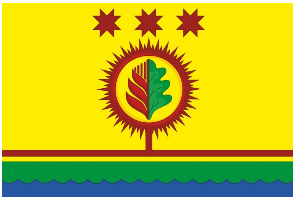
Флаг Шумерлинского района Чувашской Республики (цветное изображение)