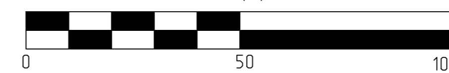
МАСШТАБНАЯ ЛИНЕЙКА (М)