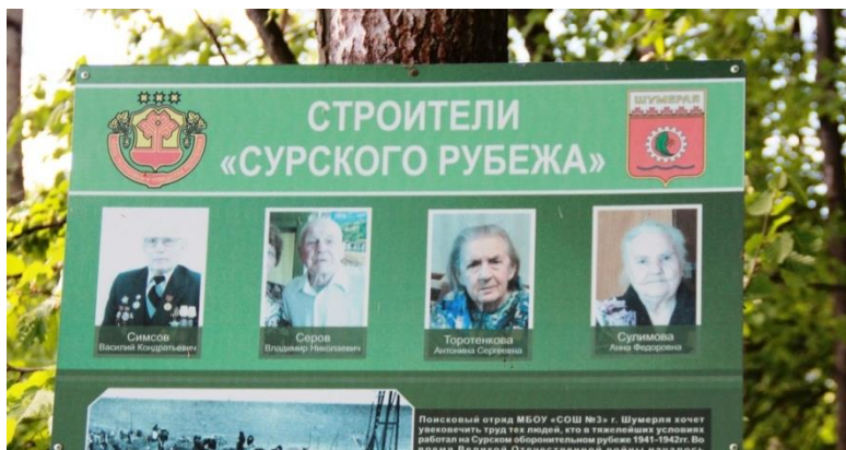
Разработка образовательных маршрутов