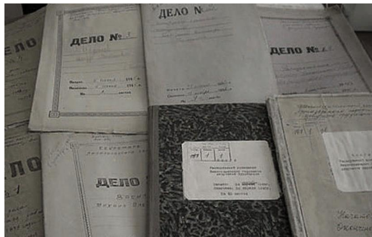
Издание научных, архивных сборников