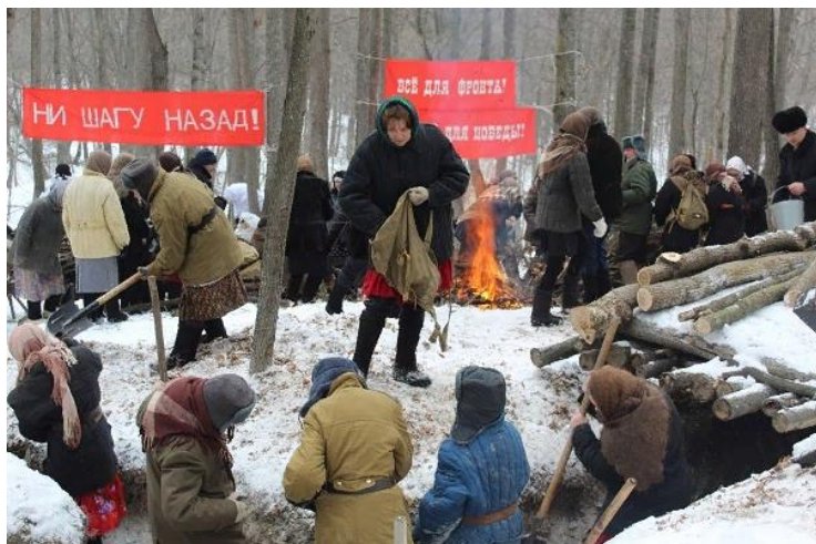
Фестивали военно-исторических реконструкций