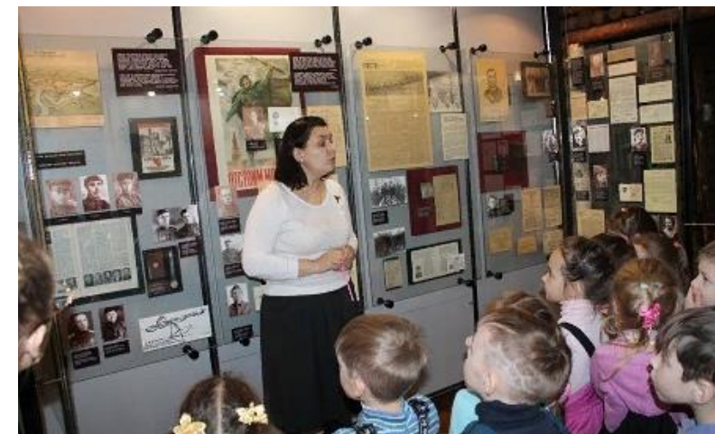
Стационарная, передвижная и электронные выставки