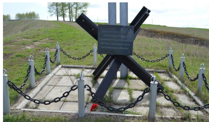
Установка и благоустройство памятных стел