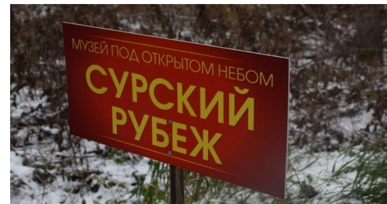
Музеефикация территорий строительства