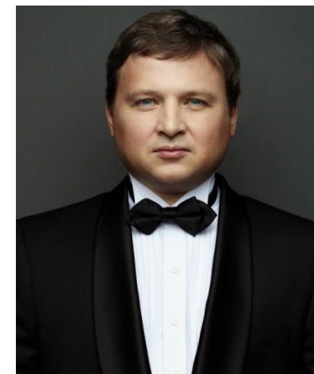
Анатолий Рыбалко главный дирижер симфонического оркестра Карельской государственной филармонии