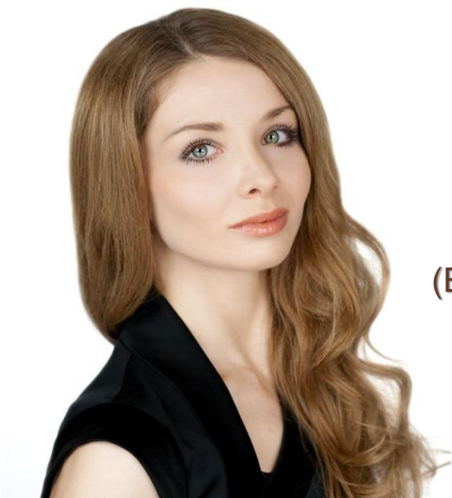
Евгения Образцова (Большой театр, г. Москва)