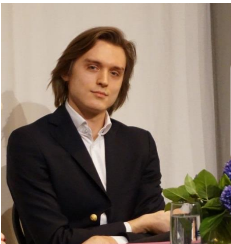
Денис Родькин (Большой театр, г. Москва)