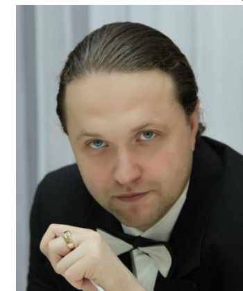
Сергей Кисс главный дирижер Ивановского музтеатра