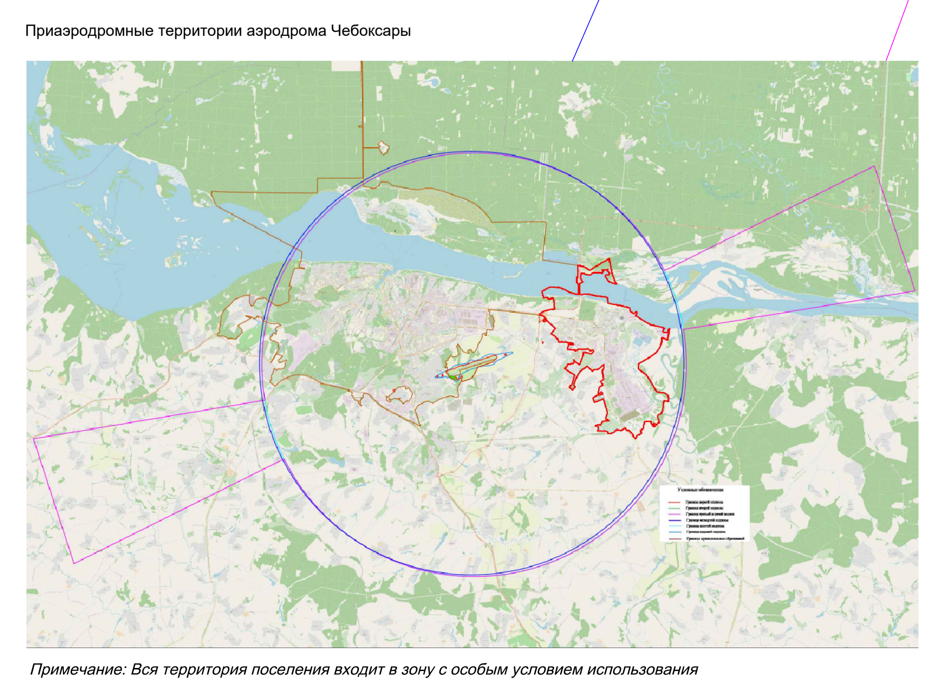
Примечание: Все территории поселения входят в зону с особыми условиями использования территории - приаэродромной территории аэродрома Чебоксары - 5, 6 подзоны