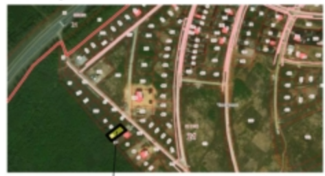
Участок с кадастровым номером 21:21:090303:63