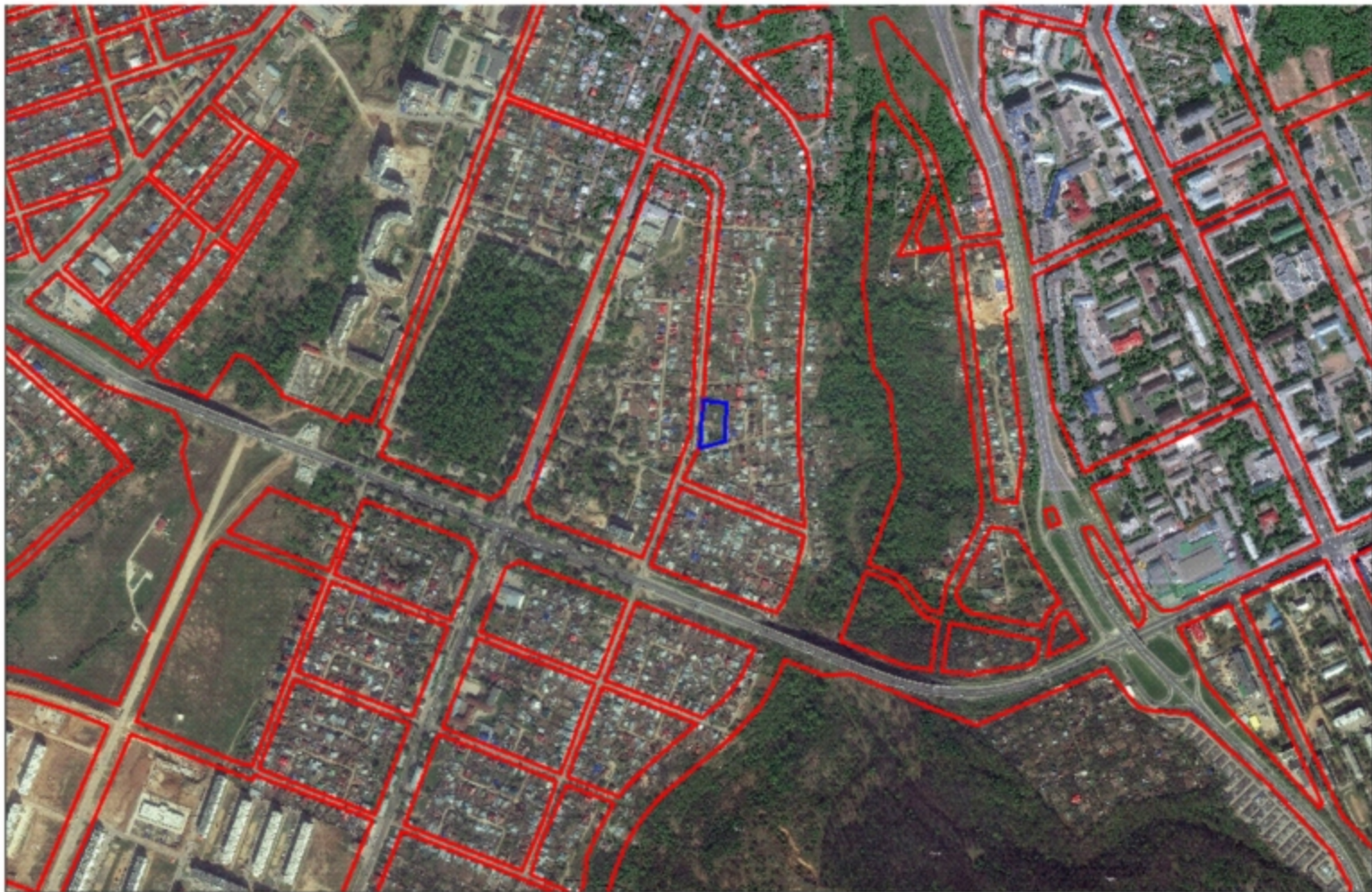
Схема расположения земельного участка на плане города