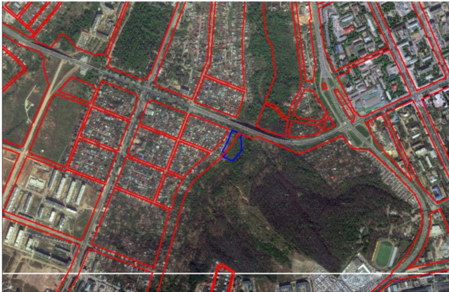
Схема расположения земельного участка на плане города