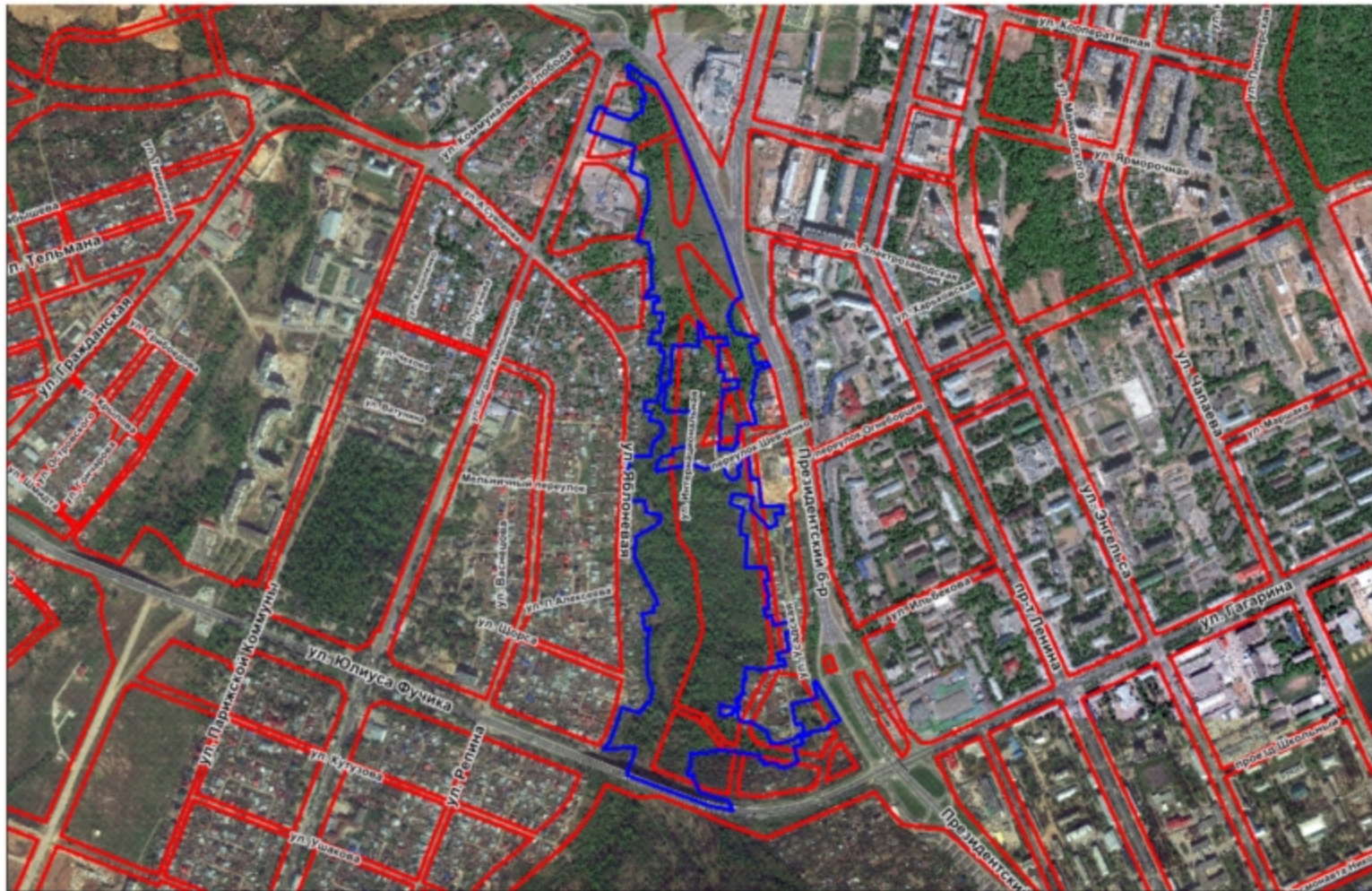
Схема расположения земельного участка на плане города