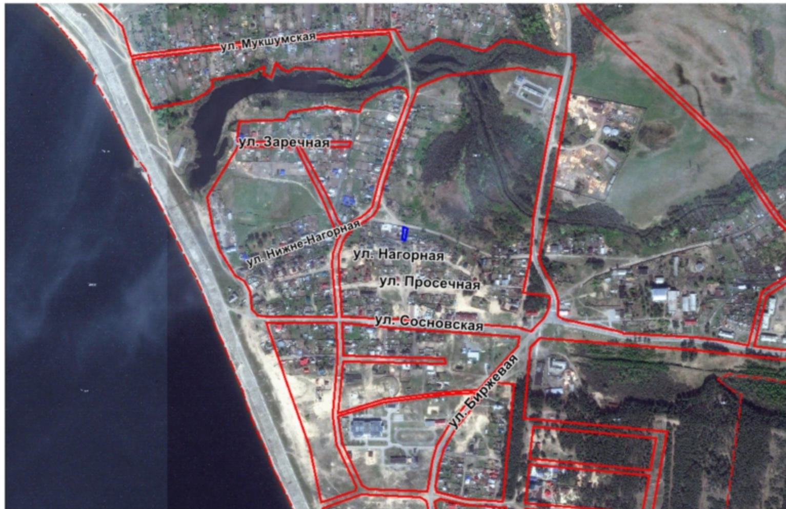
Схема расположения земельного участка на плане города