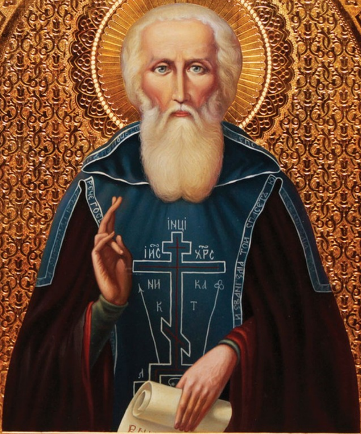
СВѢТІЙ ПАПЪ РАДОНЕЖСКІЙ ЧУ