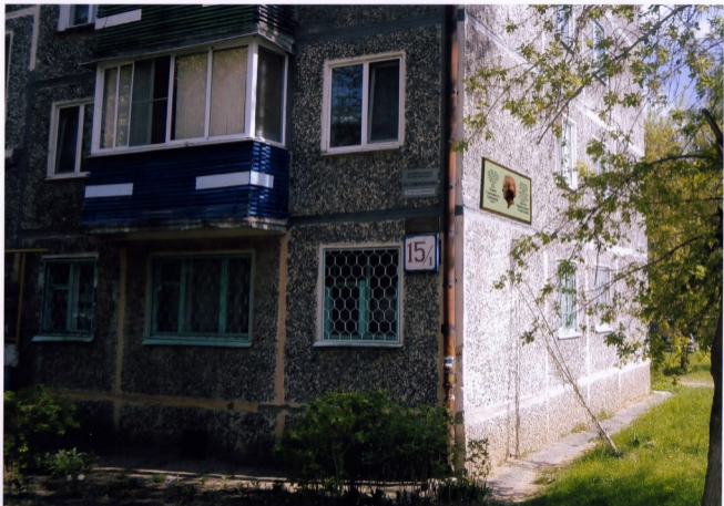
Размещение мемориальной доски М.С. Спирidonову. на торце дома по ул. Урукова д.15/1.