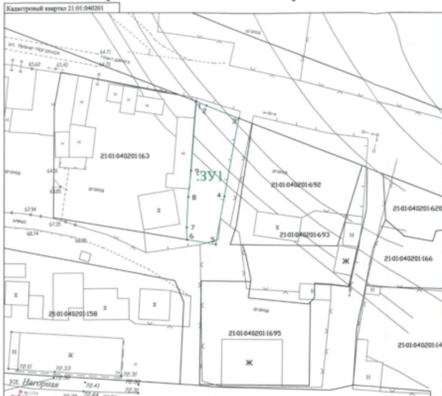
Система координат кадастрового округа

Согласовано документом от утверждения, вынесенным _____ Согласовано _____ Согласовано _____ или подписанном _____ от _____ № _____