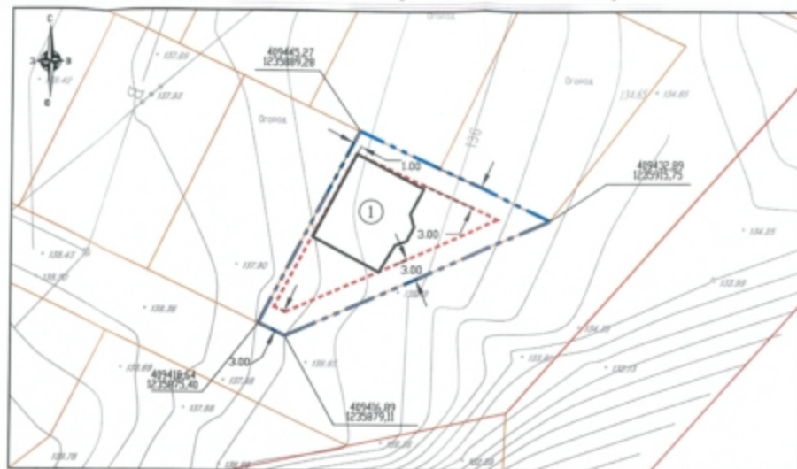
Экспликация зданий и сооружений