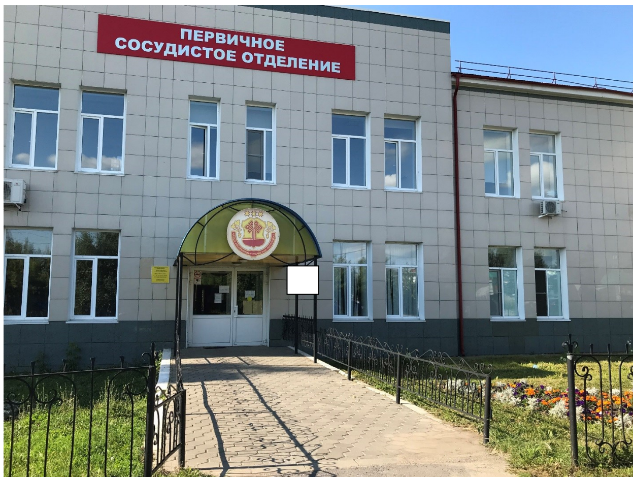
Фото фрагмента фасада с привязкой к месту установки информационной надписи.

5. Схема установки информационной надписи на объект культурного наследия и фотофиксация объекта культурного наследия с указанием места предполагаемого размещения информационной надписи.