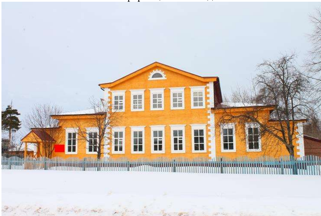
Фото фрагмента фасада с привязкой к месту установки информационной надписи.