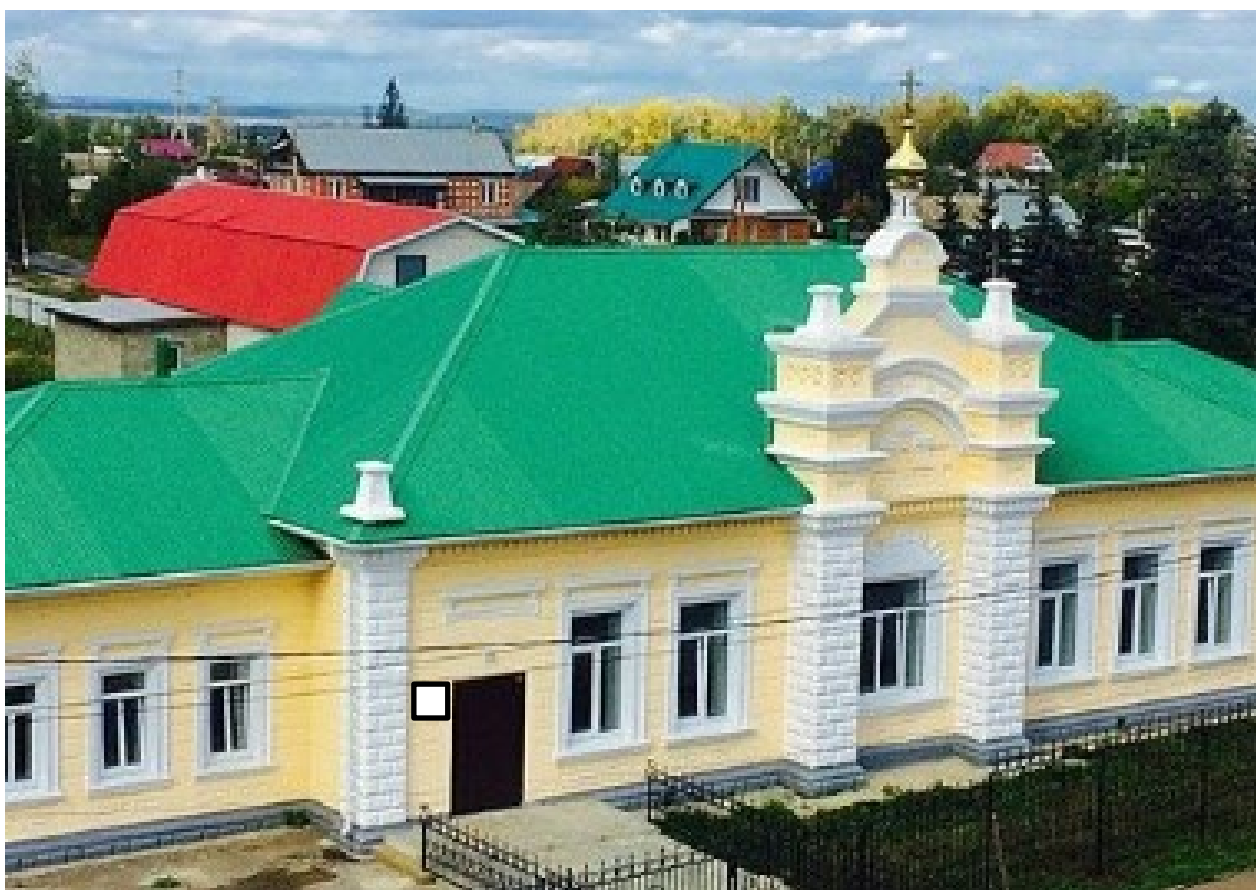
Фото фрагмента фасада с привязкой к месту установки информационной надписи.

5. Схема установки информационной надписи на объект культурного наследия и фотофиксация объекта культурного наследия с указанием места предполагаемого размещения информационной надписи.