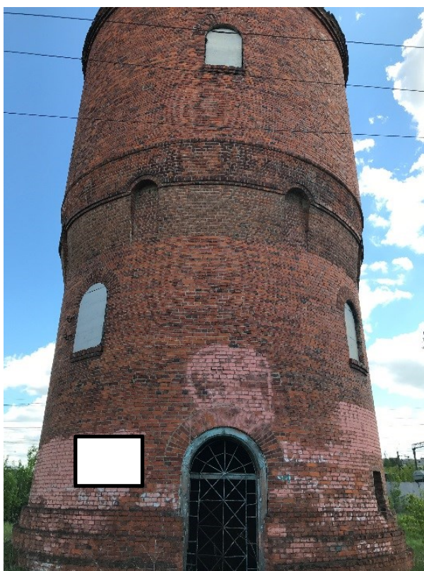
Фото фрагмента фасада с привязкой к месту установки информационной надписи.

5. Схема установки информационной надписи на объект культурного наследия и фотофиксация объекта культурного наследия с указанием места предполагаемого размещения информационной надписи.