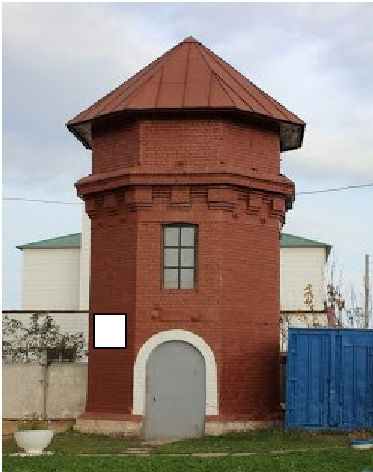
Фото фрагмента фасада с привязкой к месту установки информационной надписи.

5. Схема установки информационной надписи на объект культурного наследия и фотофиксация объекта культурного наследия с указанием места предполагаемого размещения информационной надписи.