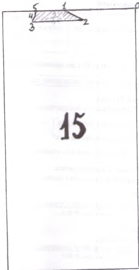
Данные инструментальной съемки границ участка: