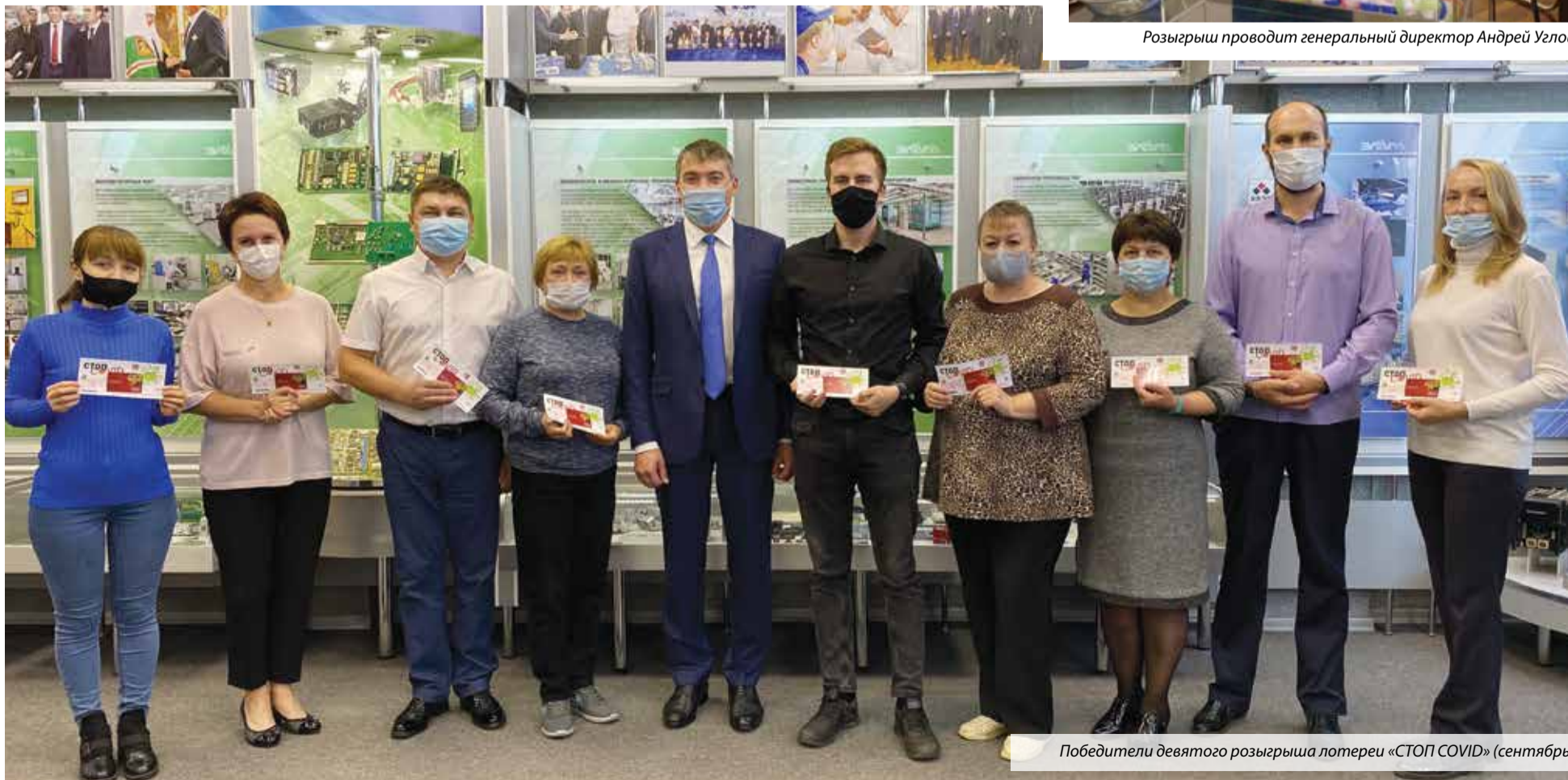
Победители девятого розыгрыша лотереи «СТОП COVID» (сентябрь)