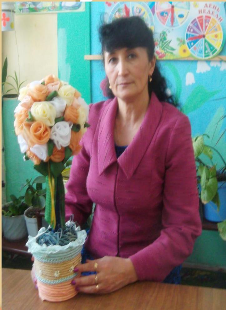
Букет цветов из ленточек