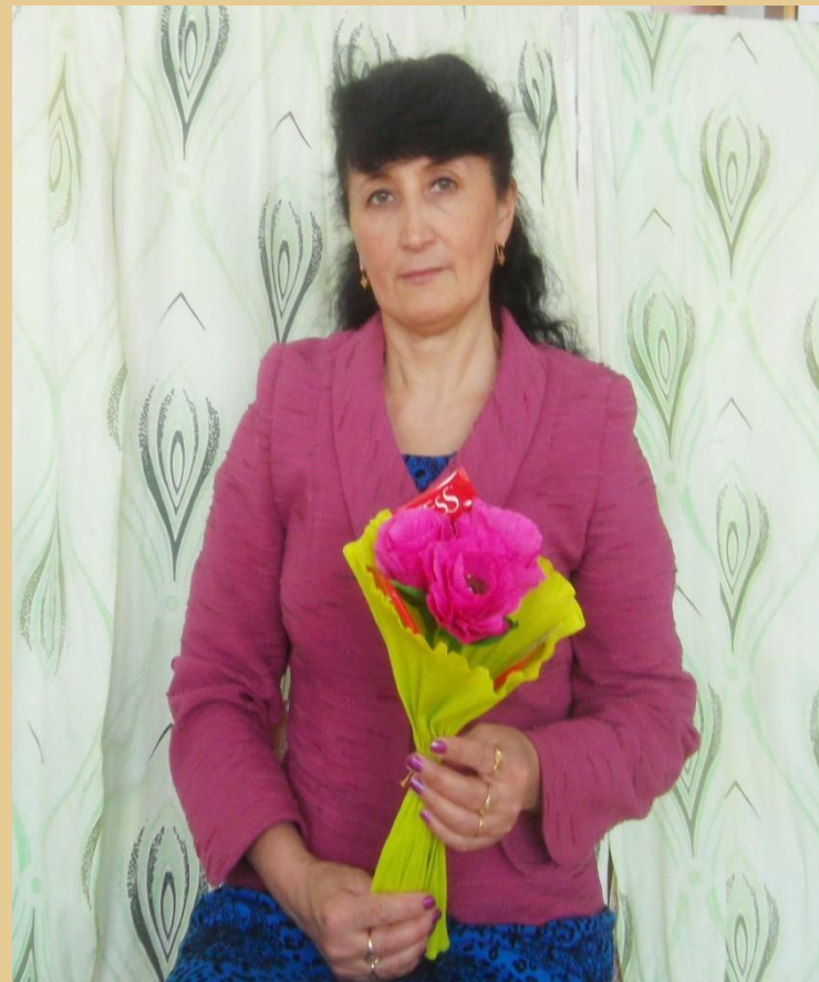
Букет цветов из гофрированной бумаги