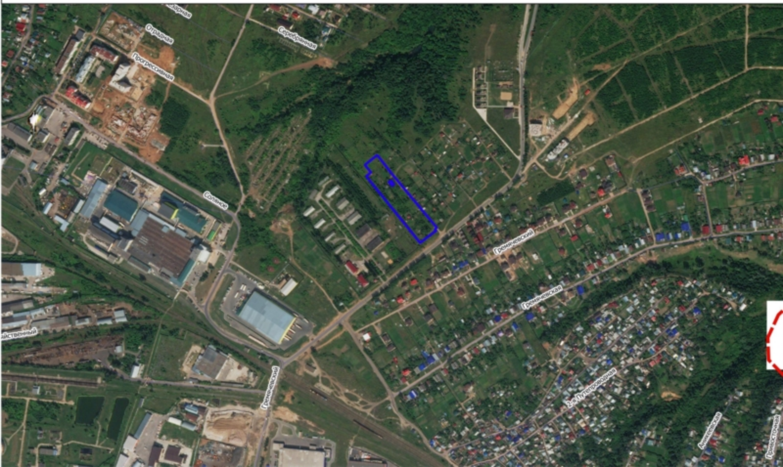
Схема земельного участка на плане города