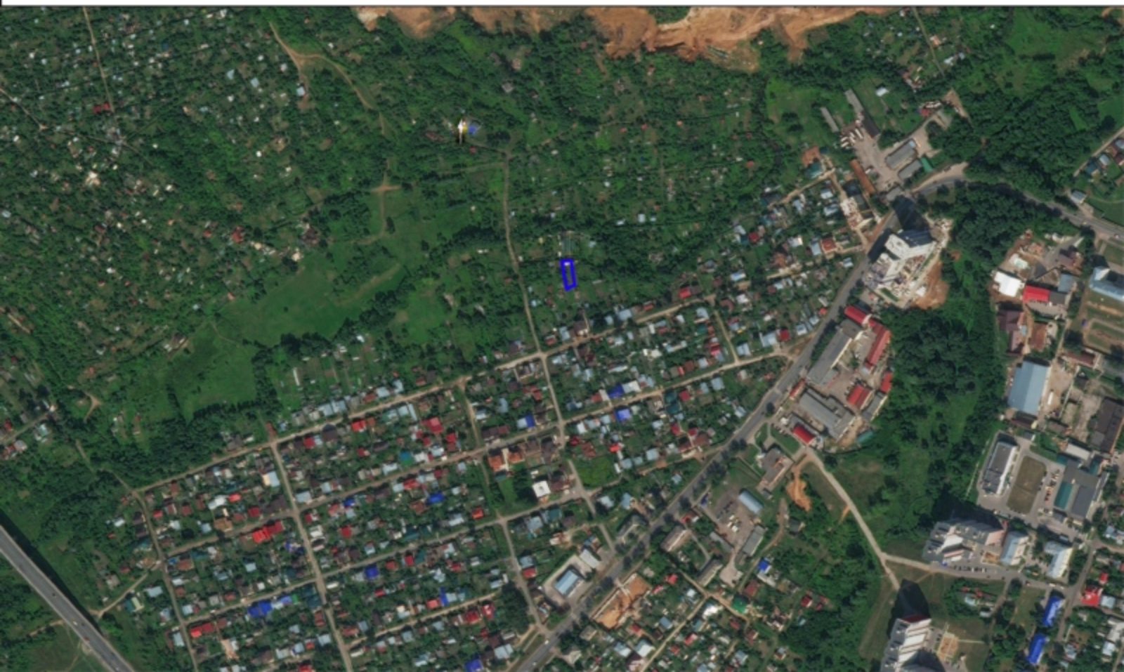
Схема земельного участка на плане города