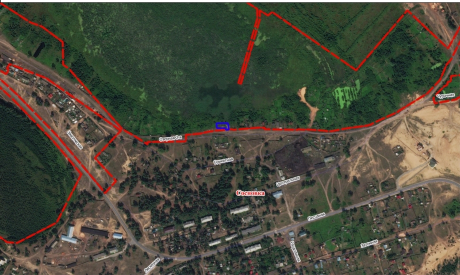
Схема земельного участка на плане города