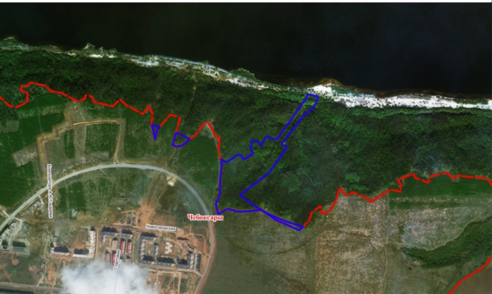
Схема земельного участка на плане города