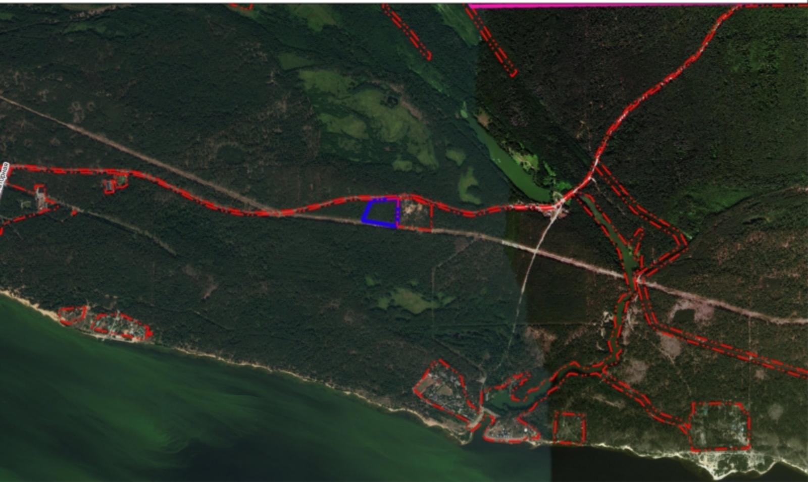
Схема земельного участка на плане города