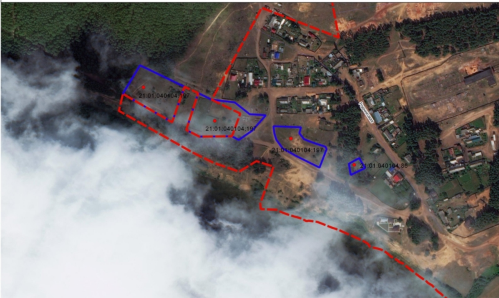
Схема земельного участка на плане города