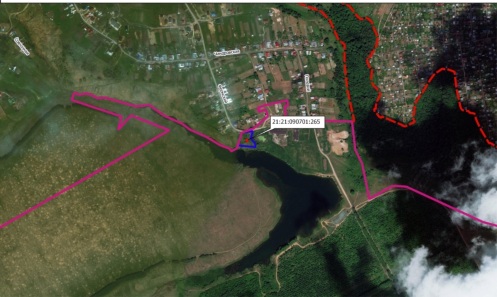
Схема земельного участка на плане города