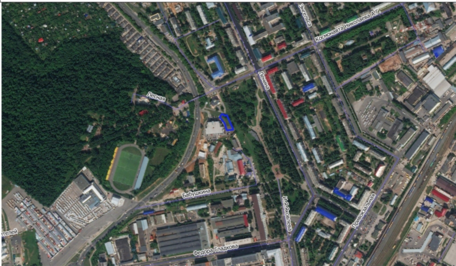
Схема земельного участка на плане города