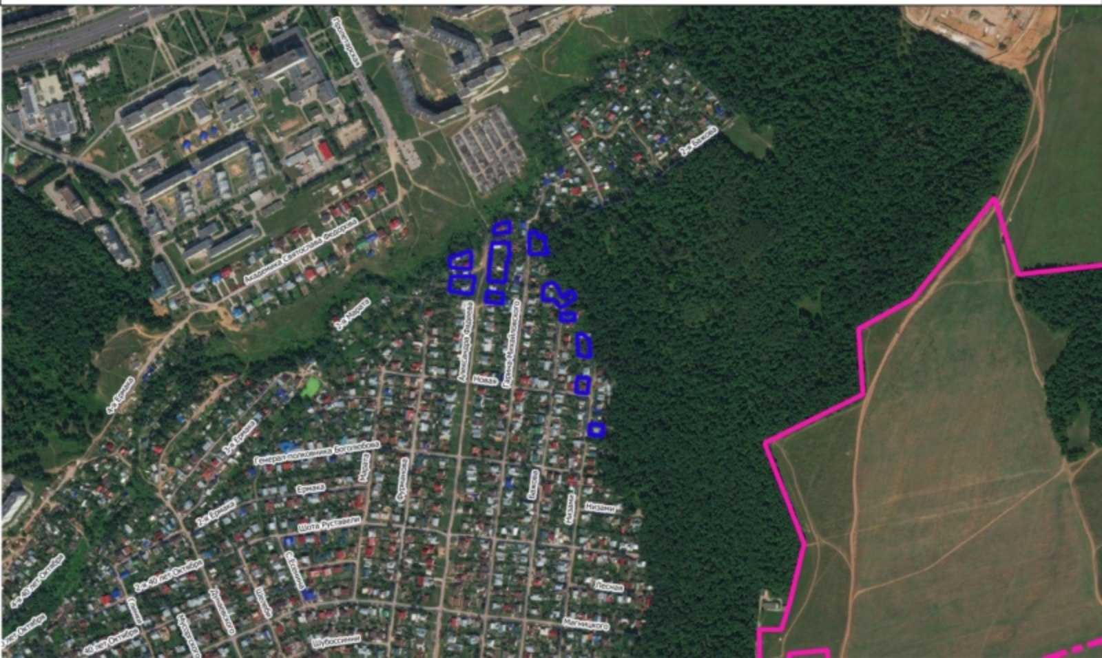
Схема земельного участка на плане города