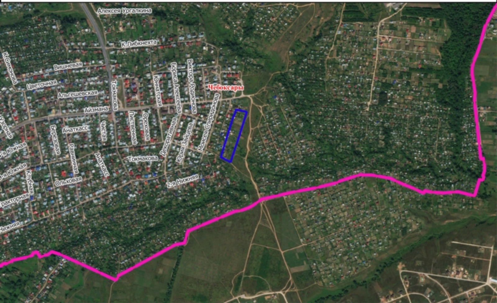
Схема размещения земельного участка на плане города