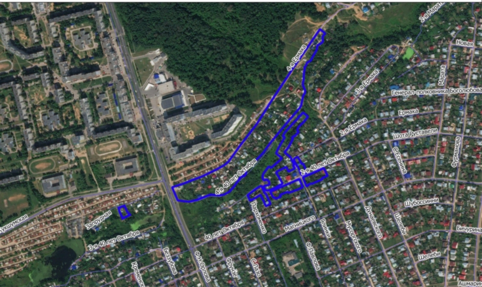
Схема размещения земельного участка на плане города