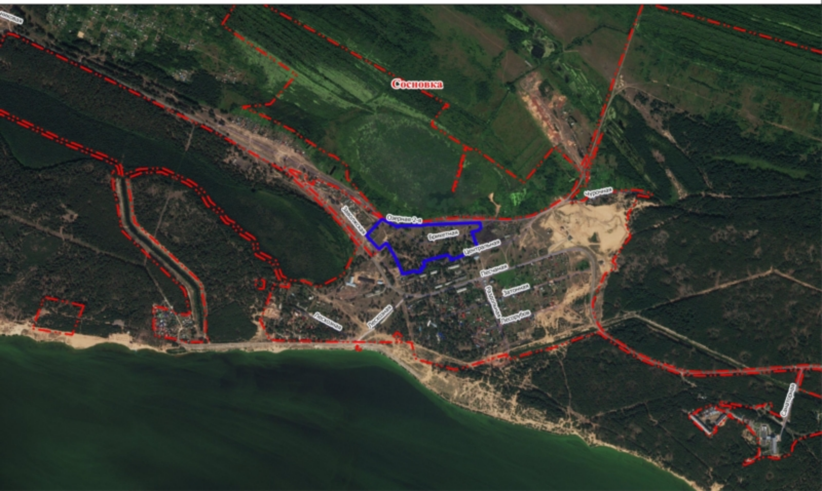
Схема земельного участка на плане города