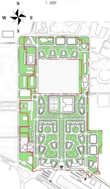
Схема озеленения 1:5000