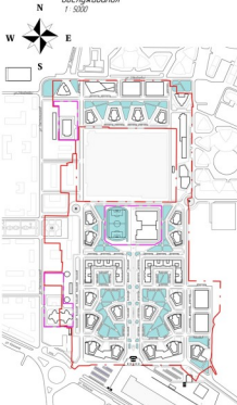
Схема размещения площадок дворового обслуживания 1:5000