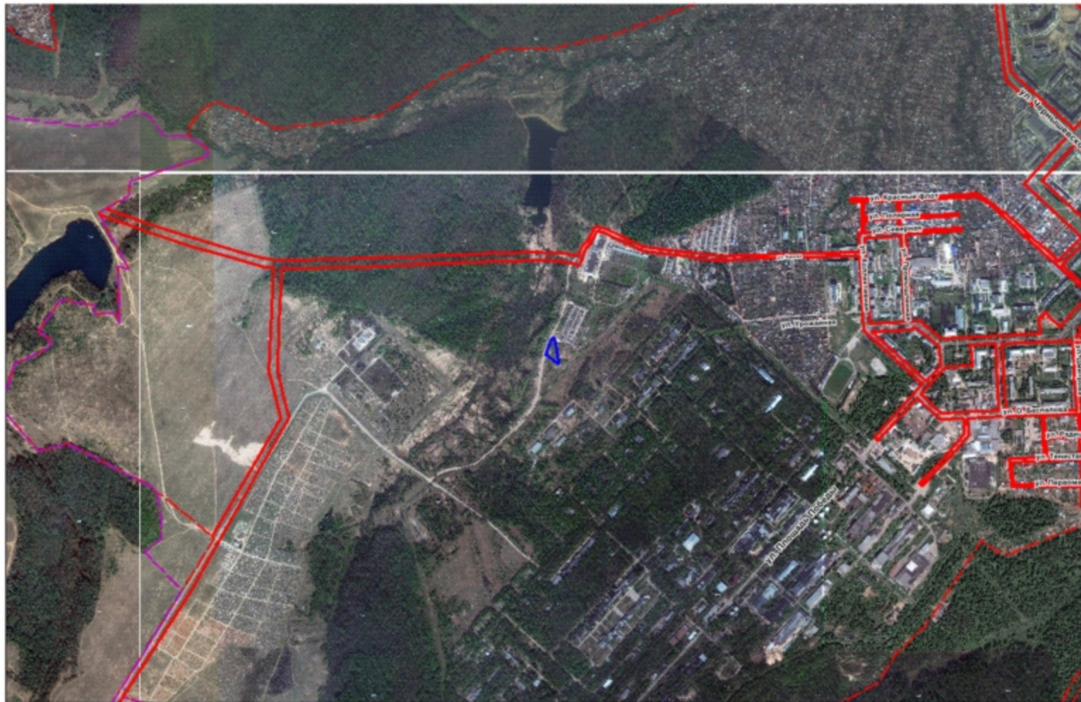
Схема расположения земельного участка на плане города