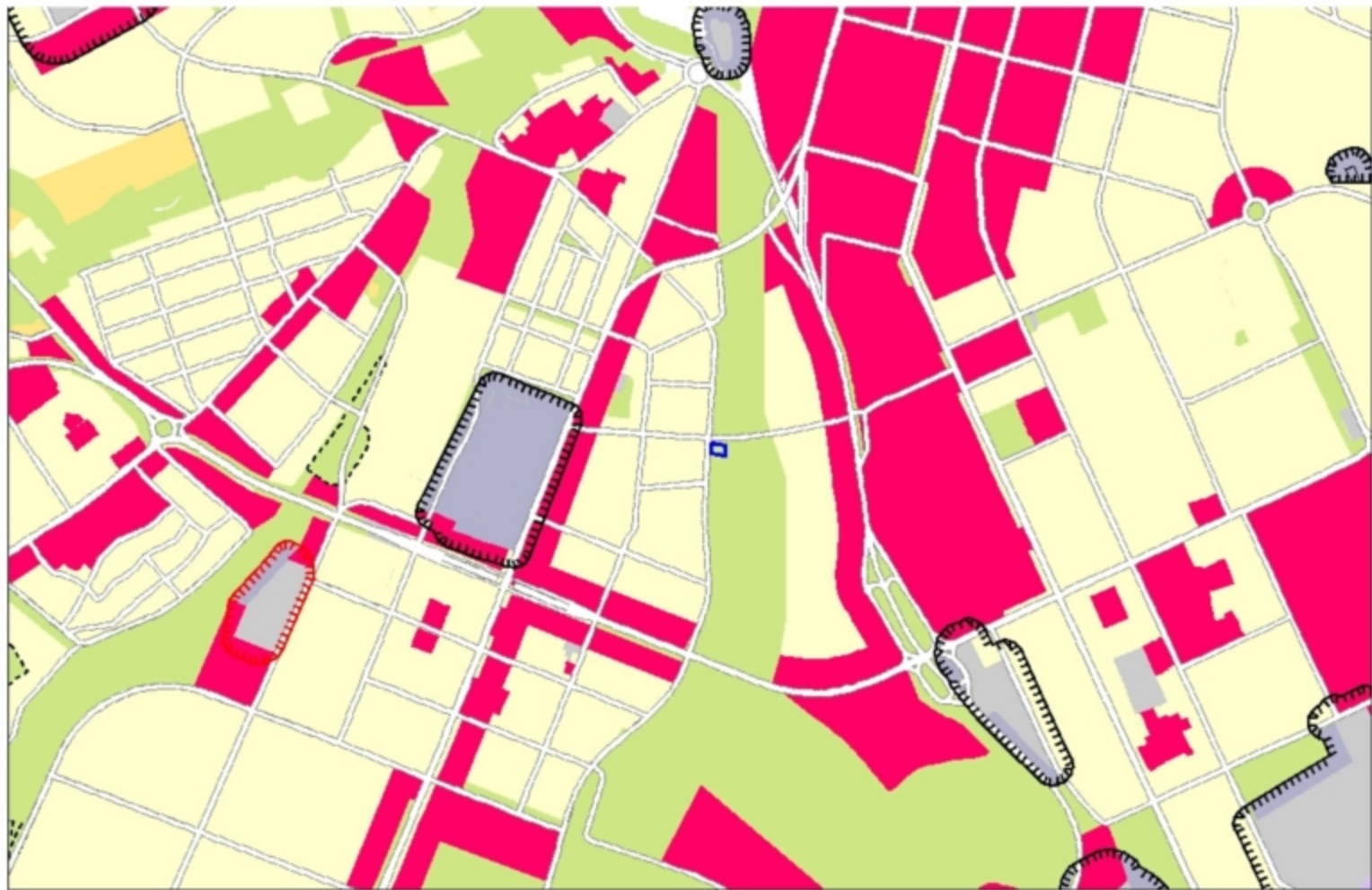
Фрагмент карты функционального зонирования (Генеральный план)