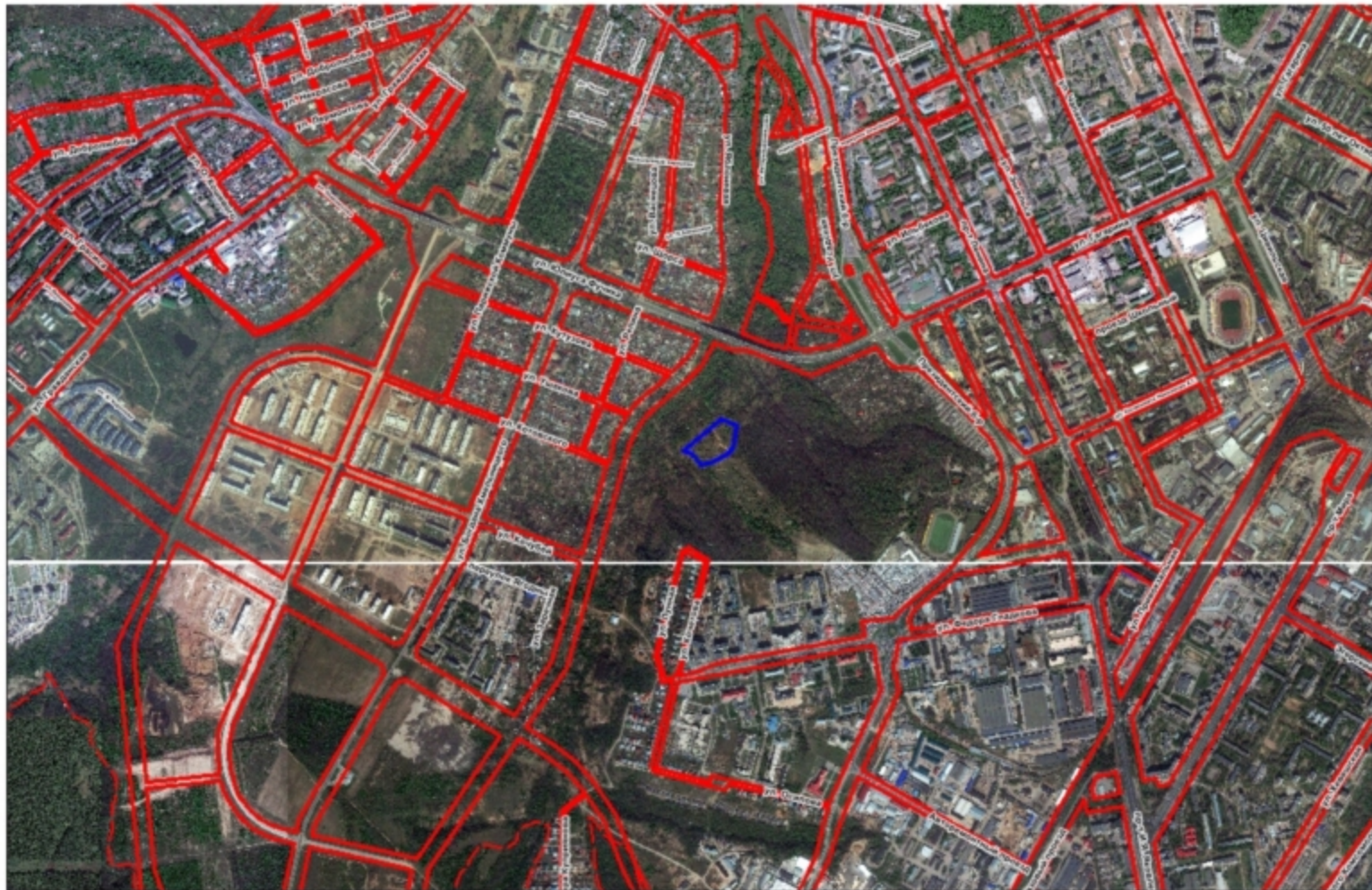
Схема расположения земельного участка на плане города