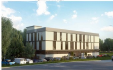
Перспективный вид 2