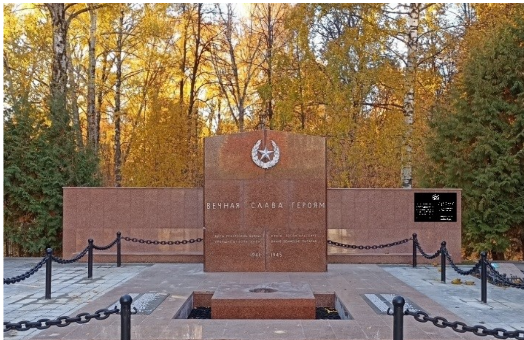
Фото объекта с привязкой к месту установки информационной надписи.