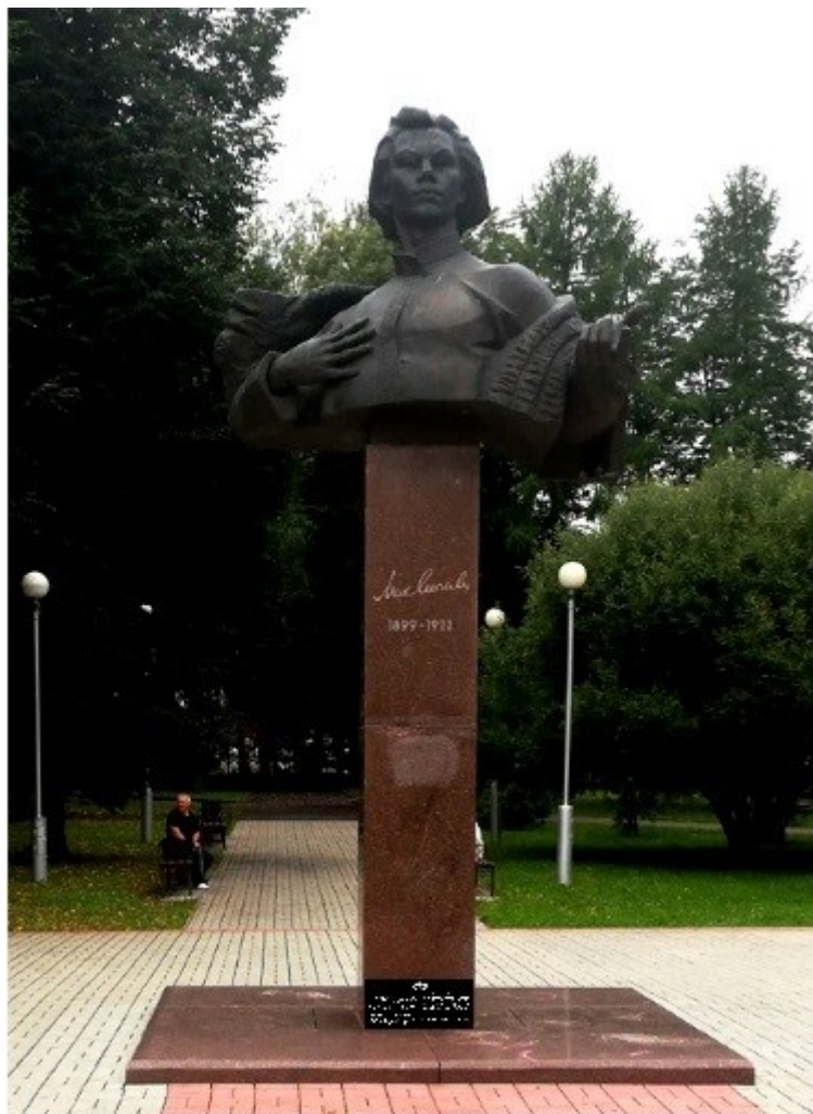
Фото объекта с привязкой к месту установки информационной надписи.