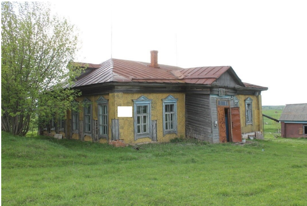
Фото фрагмента фасада с привязкой к месту установки информационной надписи.