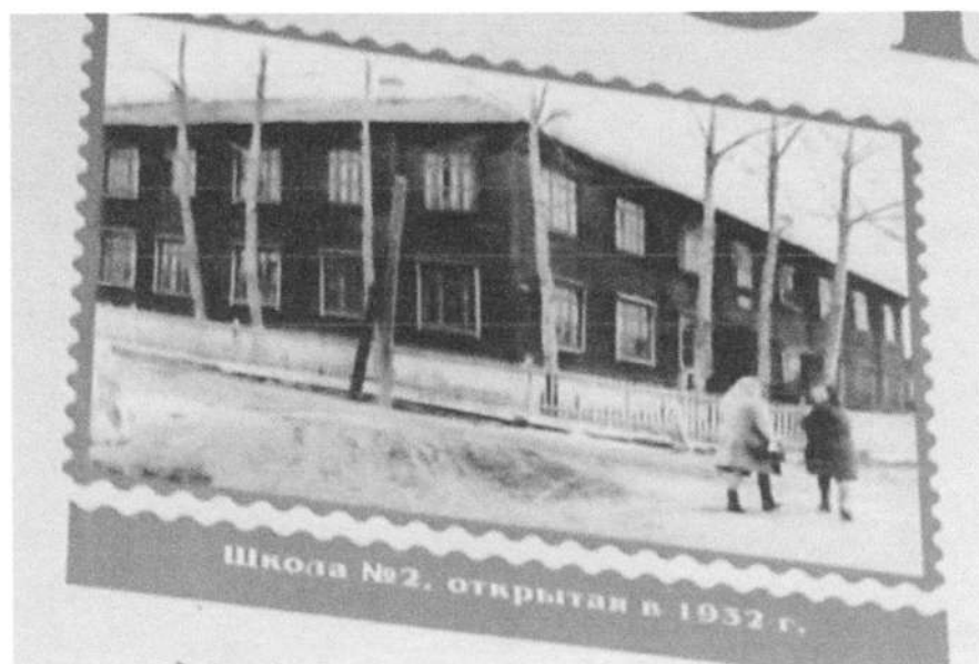
Фото № 6.