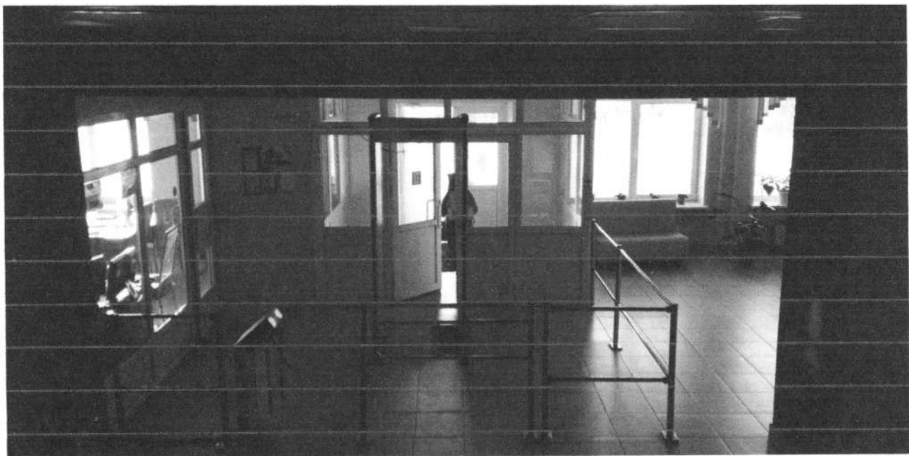
Фото № 7. Входная группа, внутренний интерьер.