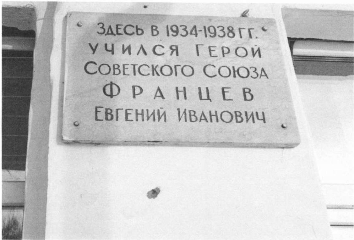
Фото № 9. Информационная табличка.