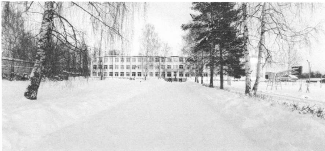
Фото № 1.

(Чувашская Республика, г. Шумерля, ул. Пушкина, д. 21)