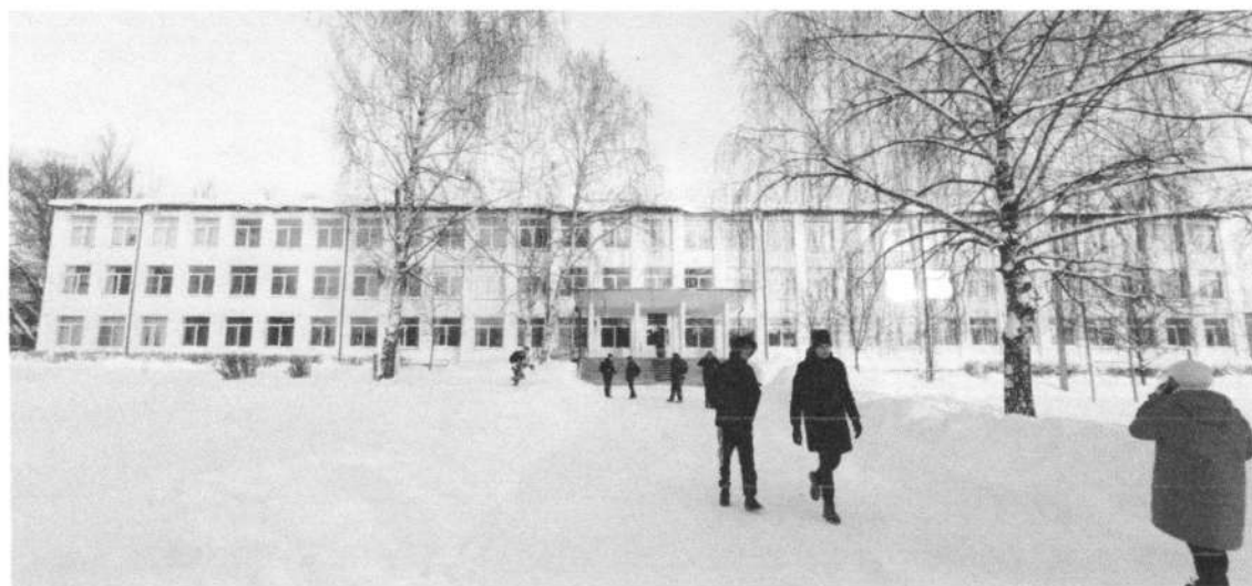
Фото № 2. Фото № 1,2. Фрагмент главного фасада