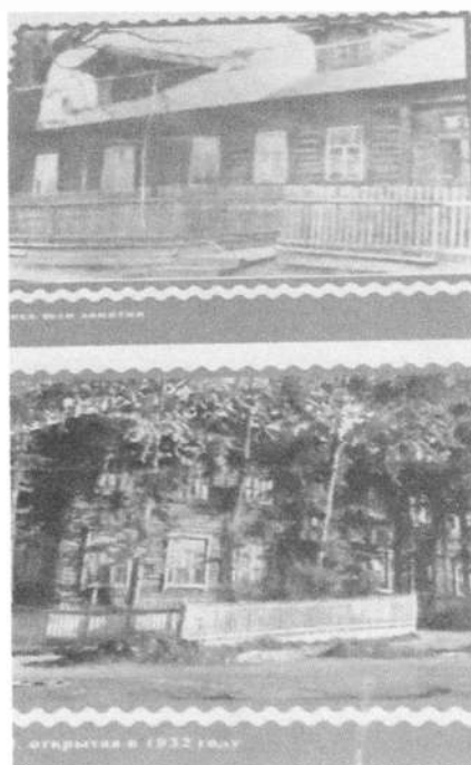
Фото № 4,5,6. Архивные фотографии школы.