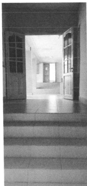
Фото № 8. Лестница, соединяющая здания переходом.