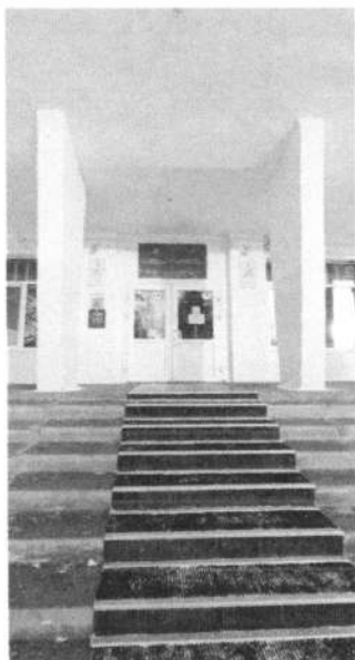
Фото № 3. Входная группа в здание школы.