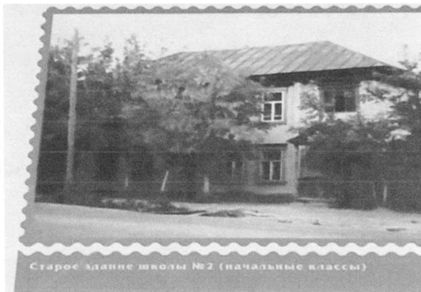
Фото № 5.