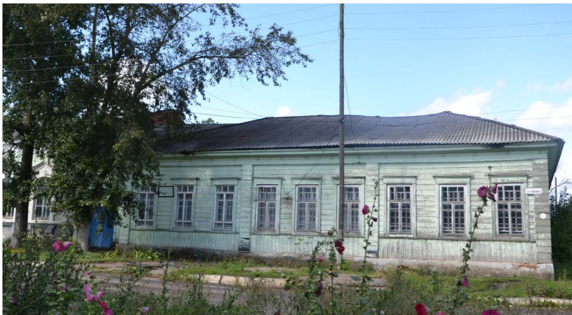
Фото фрагмента фасада с привязкой к месту установки информационной надписи.