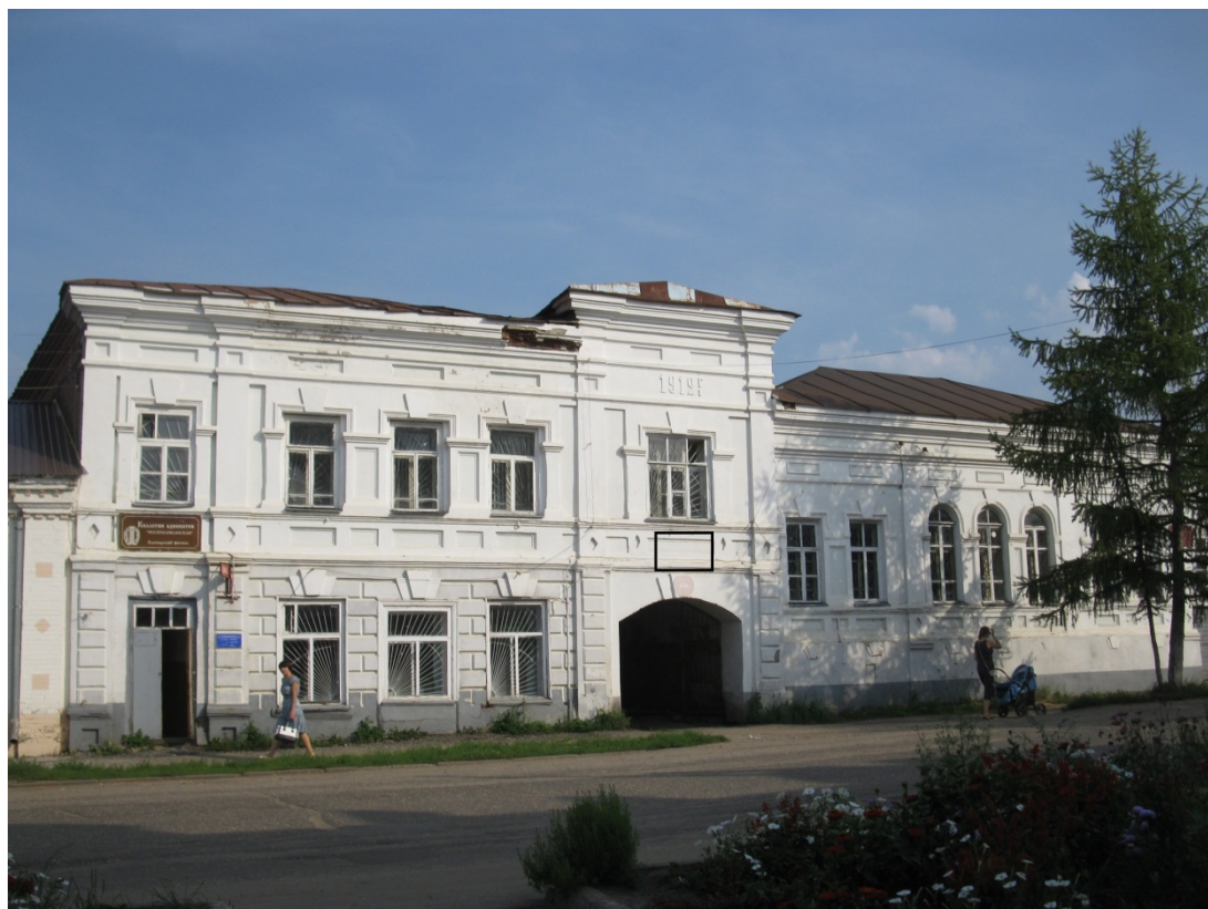
Фото фрагмента фасада с привязкой к месту установки информационной надписи.